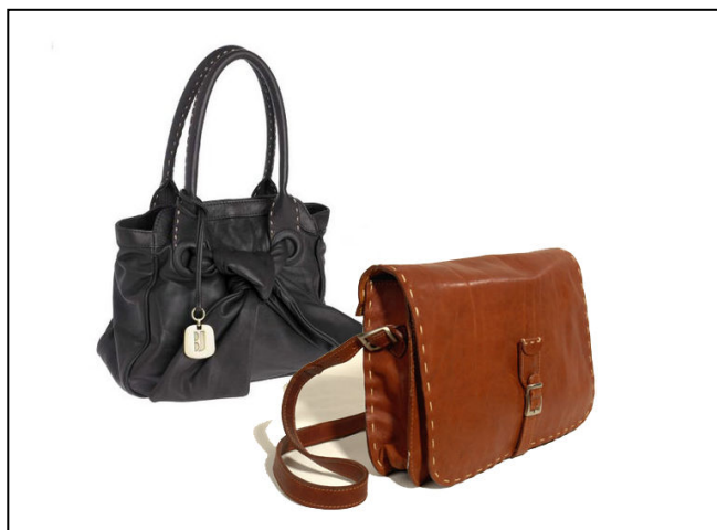
نمونه کیفهای مردانه و زنانه