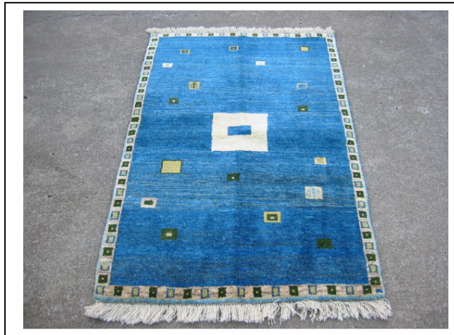
نمونه گبه بافته شده توسط کارآموز