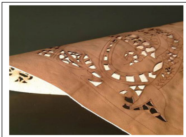
برشکاری روی چرم