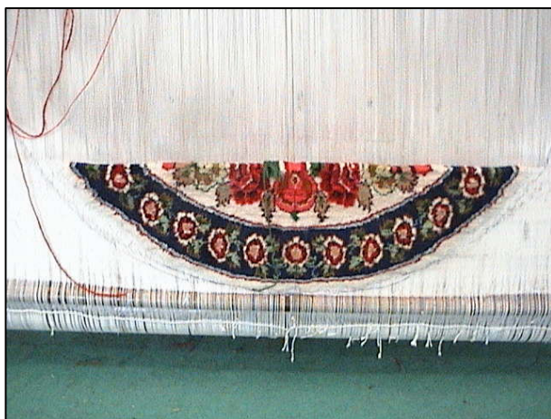
نمونه کار انجام شده توسط کارآموز