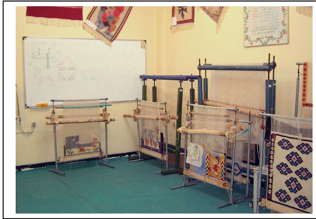
کارگاه گبه بافی