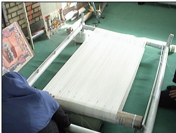
آماده سازی دار قالی در کارگاه توسط کارآموز