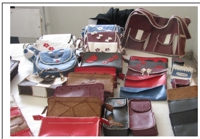
نمونه کارهای انجام شده توسط کارآموزان