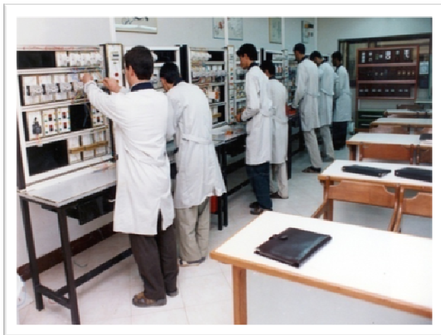
کارآموزان در حال نصب مدارات الکتریکی درون کارگاه