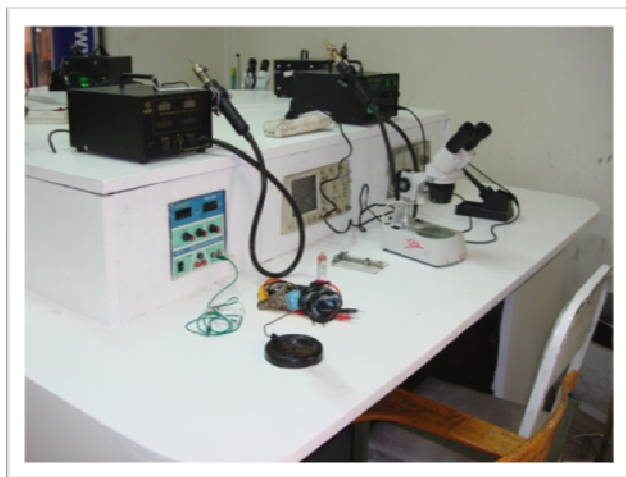
میز کار تعمیر تلفن همراه