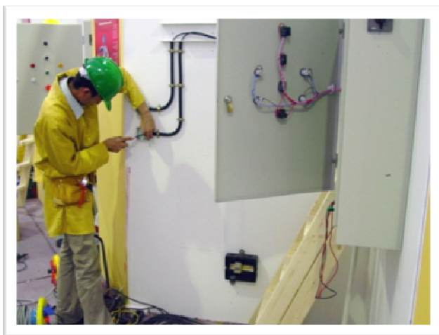
کارآموز؛ در حال نصب تابلو برق