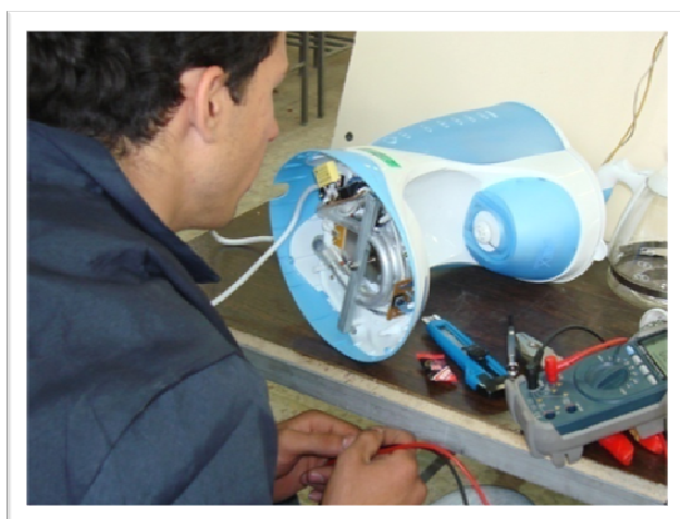
کارآموز در حال تعمیر دستگاه قهوه‌جوش