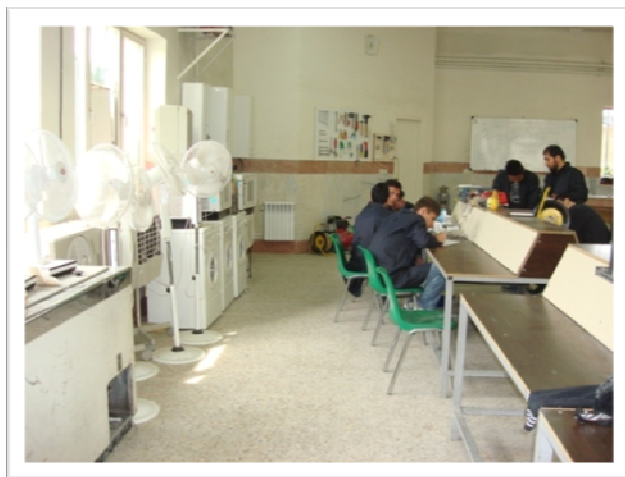
کارگاه تعمیر لوازم خانگی برقی حرارتی و گردنده