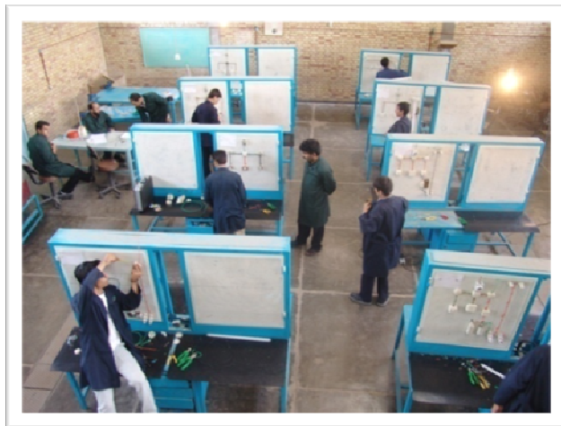
نمای کارگاه آموزشی برق ساختمان