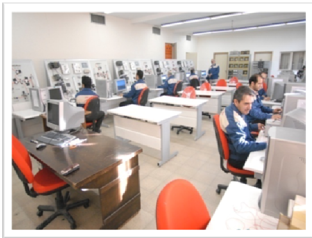
کارگاه آموزش پنوماتیک