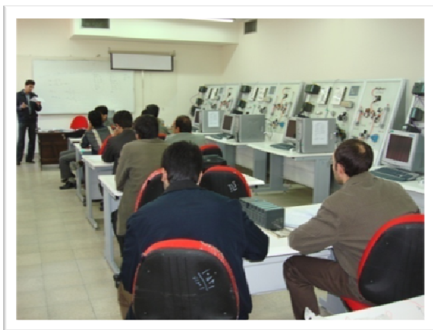
کارگاه آموزش نظری