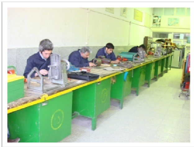
کارگاه آموزشی تعمیر ماشین‌های الکتریکی