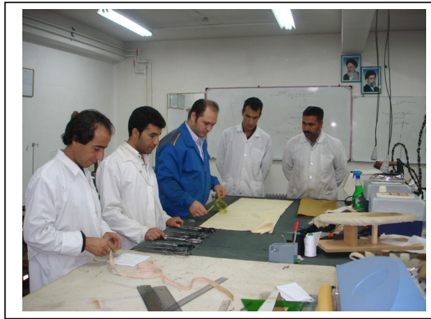
کارآموزان در حال آموزش