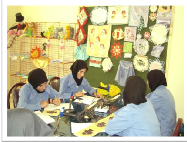
کارگاه آموزشی، کارآموزان در حال تمرین