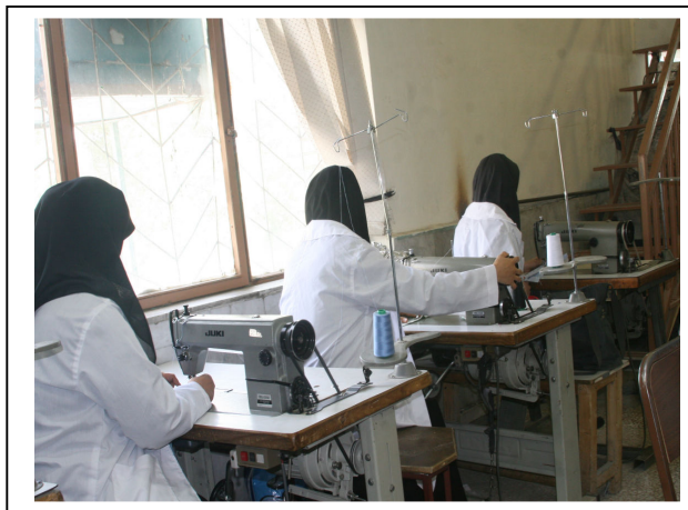
کارآموزان در حال دوخت