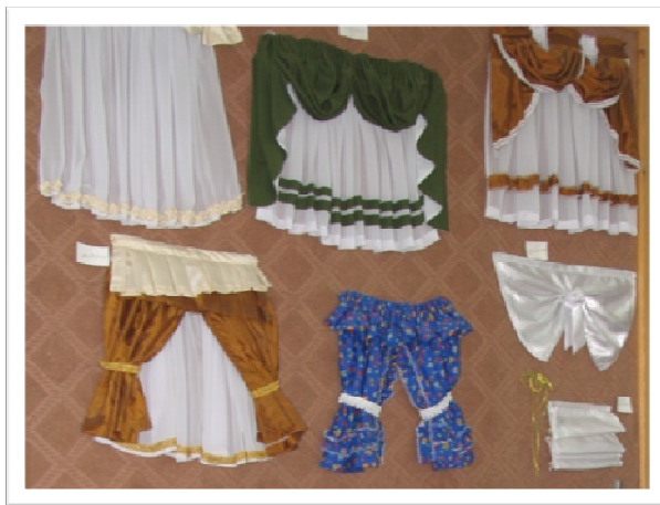
دوخت انواع پرده توسط کارآموزان