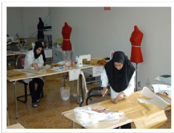
کارآموزان در حال آزمون