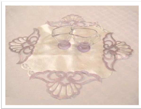
هویه کاری روی پارچه نایلونی