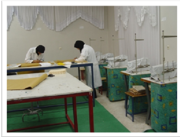
کارگاه آموزش پرده دوزی