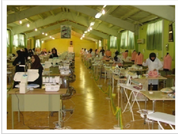
نمایی از فعالیت مهارت آموختگان