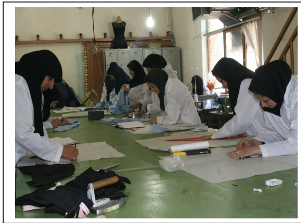
کارگاه طراحی لباس زنانه