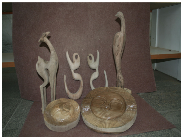
نمونه کار های پیکرتراشی کارآموزان