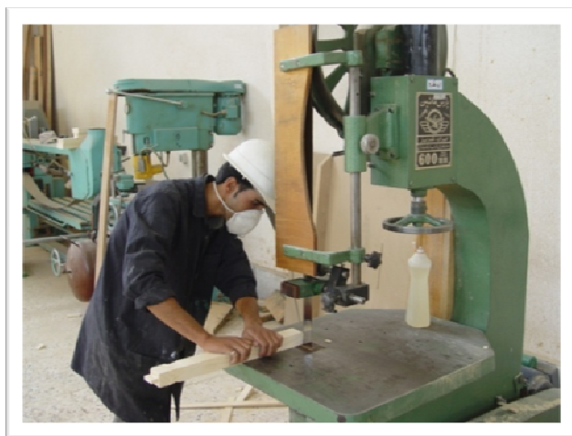
کارآموز در حال کار با اره