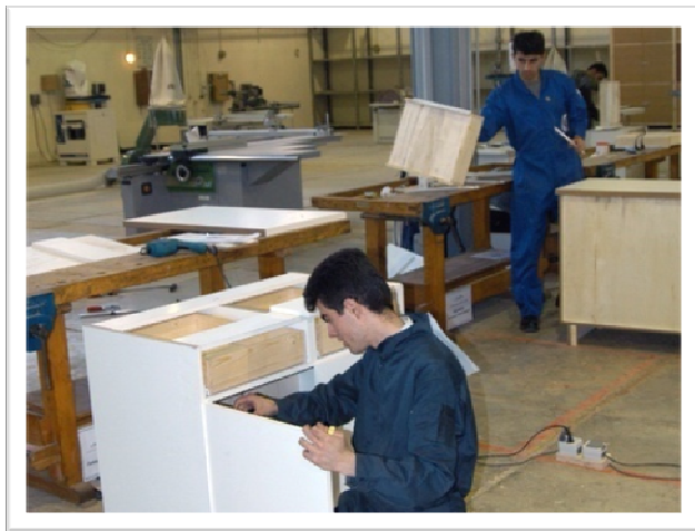
کارگاه کابینت‌سازی چوبی