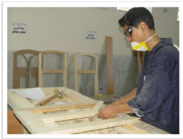
ساخت پنجره توسط کارآموز در کارگاه درودگری