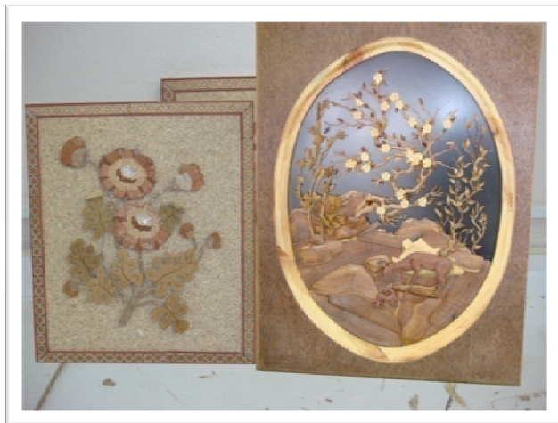
نمونه کارهای کارآموزان