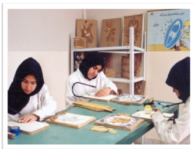
کارگاه آموزش معرق‌کار چوب