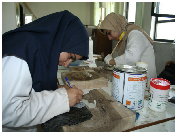
کار آموزان در حال تمرین