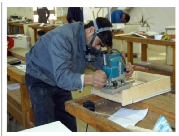
کارآموز در حال کار با رنده