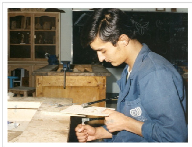
کارآموز در حال کار با کماناره