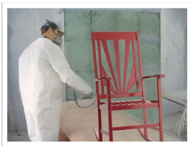
رنگکاری محصولات چوبی در کارگاه آموزشی