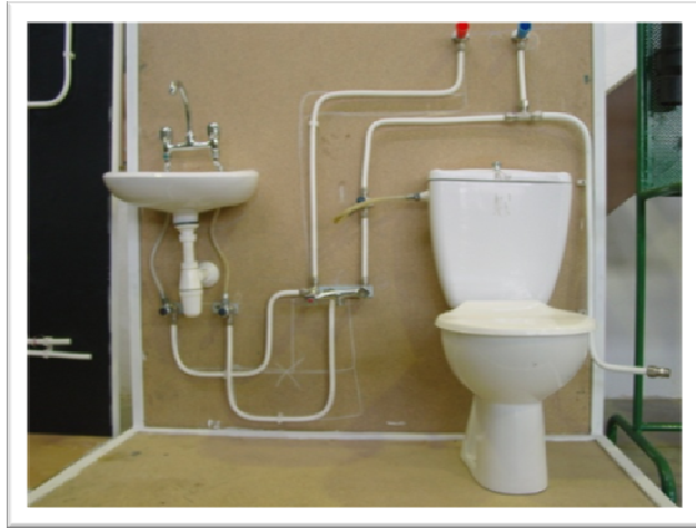
پروژه نصب وسایل بهداشتی توسط کارآموز