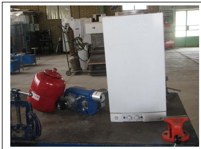
کارگاه آموزشی تعمیر پکیج شوفاژ گازی