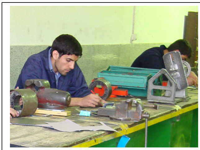
شناخت اولیه کارآموزان از سیم پیچی موتور کولر