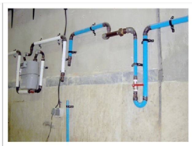
ماکت آموزشی لوله‌کشی گاز خانگی