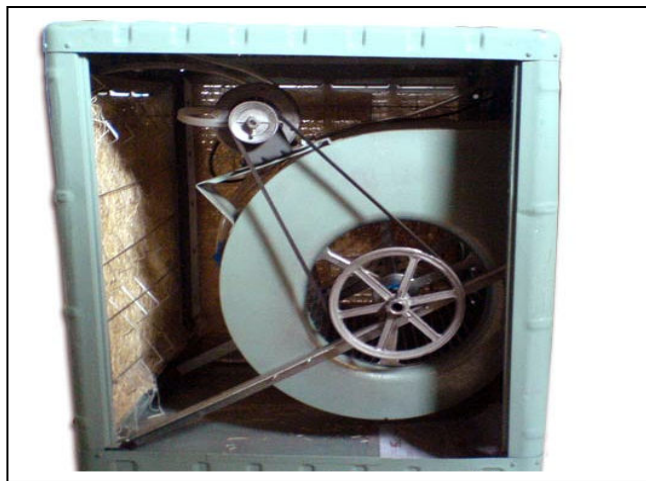
اجزای داخلی کولر آبی