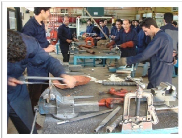
کارآموزان در حال ممارست در کارگاه تاسیسات حرارت مرکزی