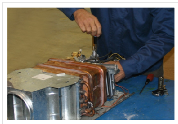
کارآموز در حال تمرین