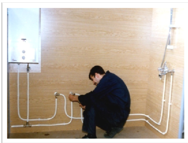
کارآموز در حال اجرای پروژه نصب پکیج حرارتی