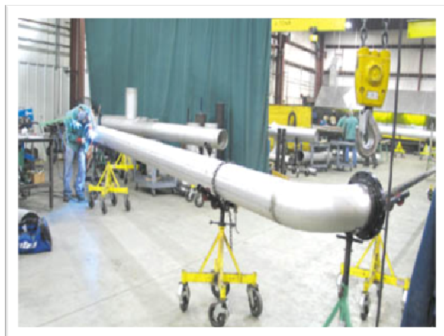
کارگاه لوله‌کشی گاز صنعتی