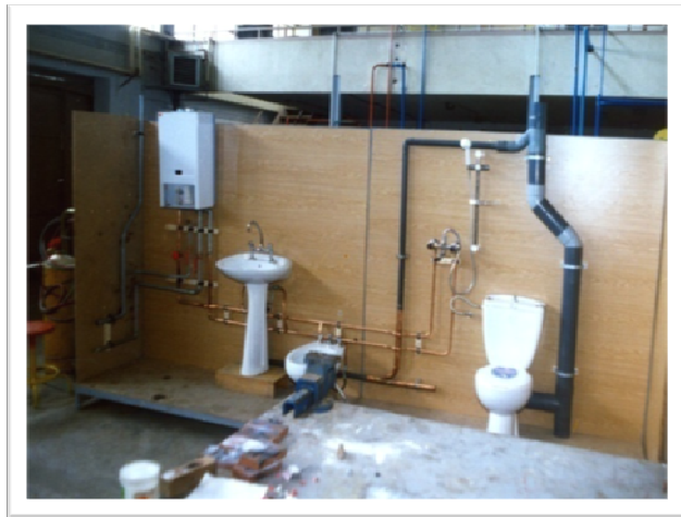
لوله کشی و نصب وسایل بهداشتی