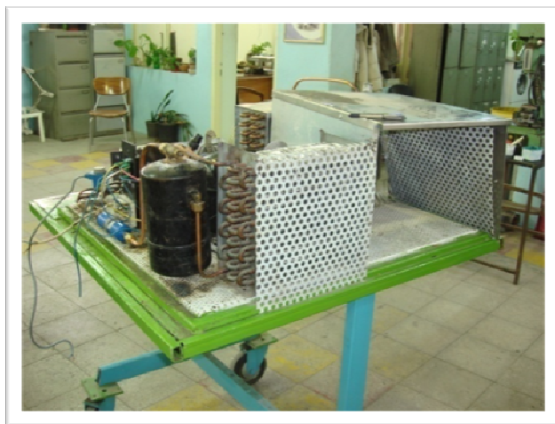
پروژه دستگاه سردکننده خانگی، اجرا شده توسط کارآموزان