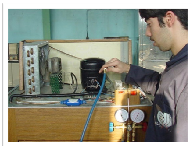
کارآموز در حال آموزش نحوه پرکردن گاز یخچال